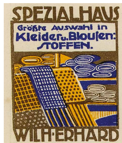
Werbemarke aus dem Weißwarengeschäft der Familie Erhard

Im Geburtshaus – der »Wiege der Sozialen Marktwirtschaft« – beginnt die Ausstellung im zweiten Obergeschoss, der ehemaligen Wohnung der Familie Erhard. Sie führt dem Besucher chronologisch die zentralen Stationen und Weichenstellungen im Leben von Ludwig Erhard von seiner Geburt 1897 bis zum Zusammenbruch Deutschlands 1945 vor Augen.