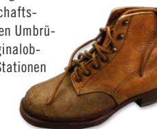
Schuh aus Erhards „Jedermann-Programm“, 1948