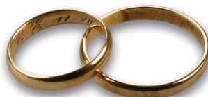
Luise und Ludwig Erhards Eheringe

In den Räumlichkeiten im zweiten Stock des Geburtshauses lebte Ludwig Erhard mit seinen Eltern und Geschwistern. Die Familie betrieb im Erdgeschoss ein Weißwarengeschäft. Die Ausstellung präsentiert Artefakte aus dem Ladengeschäft und der Familie erstmals der Öffentlichkeit.