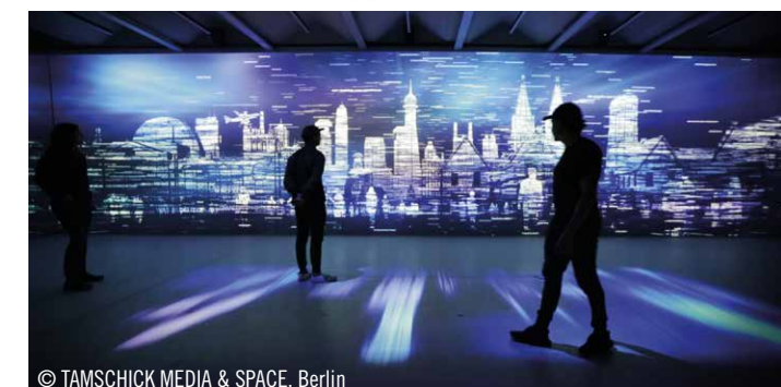
© TAMSCHICK MEDIA & SPACE, Berlin