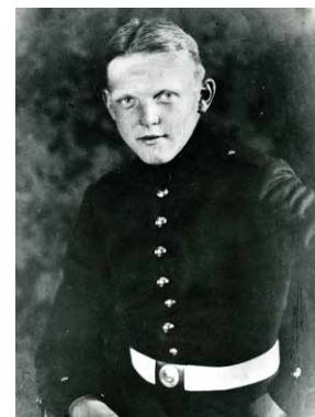
Ludwig Erhard in Ausgeh-Uniform