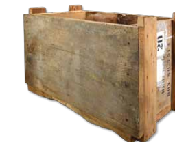
Währungsreform, 1948: Transportkiste für die neue Währung

Als Bundeswirtschaftsminister und späterer Kanzler prägte Ludwig Erhard die Bundesrepublik und schuf Grundlagen, auf die wir bis heute bauen. Die Nachkriegszeit mit ihren großen gesellschafts- und wirtschaftspolitischen Umbrüchen wird mit vielen Originalobjekten und interaktiven Stationen spannend erzählt.